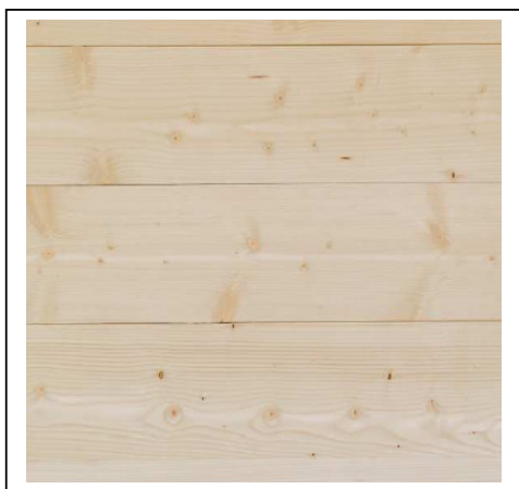
BARDAGE EPICEA DU NORD