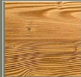
Brossé sur lame, épicéa du nord thermo-stabilisé