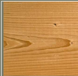
Raboté sur lame, épicéa du nord thermo-stabilisé

Sivalbp a cette capacité unique d'offrir l'ensemble de ces états de surface.