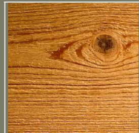
Scié fin sur lame, épicéa du nord thermo-stabilisé