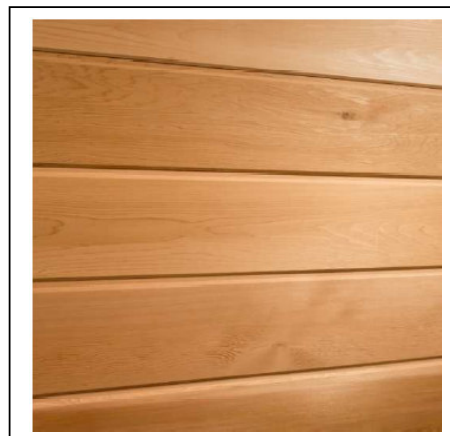
BARDAGE RED CEDAR