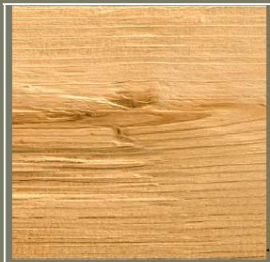
Rustique sur lame, épicéa du nord thermo-stabilisé