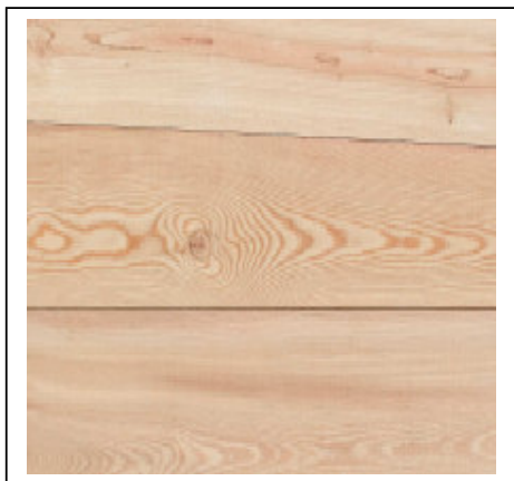
BARDAGE & PARQUET MELEZE DE SIBERIE