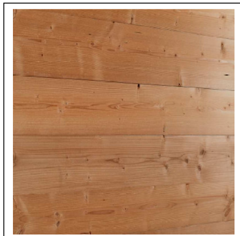
BARDAGE & PARQUETS EPICEA